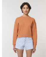
Stella Cropster Wave Terry

Shell : Terry , 85% gekämmte ringgesponnene Bio-Baumwolle , 15% recyceltes Polyester , Vorgewaschen , Weicher Griff , 300 GSM