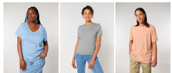
v neck shirt